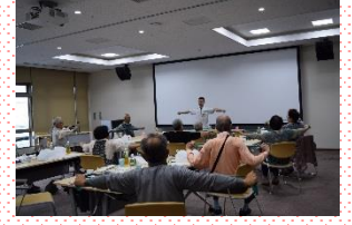
今年もクイズや体操で盛り上がりました。