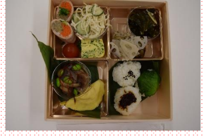
岐阜女子大学と共同開発した健康弁当