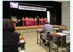
女声合唱団のコーラス みんなで大合唱！！