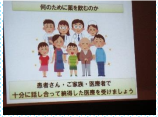
講演 お薬についてわかりやすいお話でした。