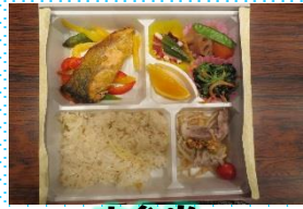
お弁当 さくら会総会の お弁当の方が見た目も味も良かったな～