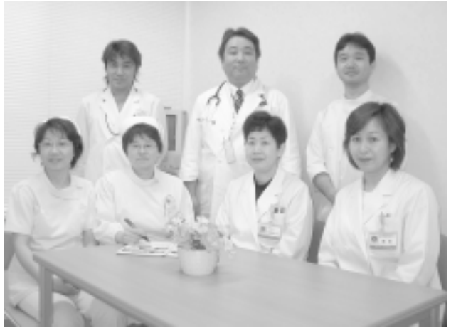
▲糖尿病専門スタッフ

医師、看護師、薬剤師、管理栄養士、臨床検査技師、理学療法士が、専門分野を生かして糖尿病治療を実施。毎月第1・3・5水曜日の14:00~15:00に『糖尿病学習会』を開催中。どなたでも参加できますので、一度参加してみてください。