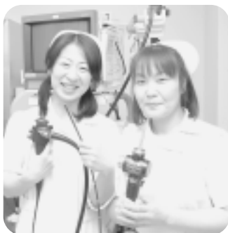
▲経鼻内視鏡検査装置 内視鏡先端の直径は5mm以下。 鉛筆よりも細い。