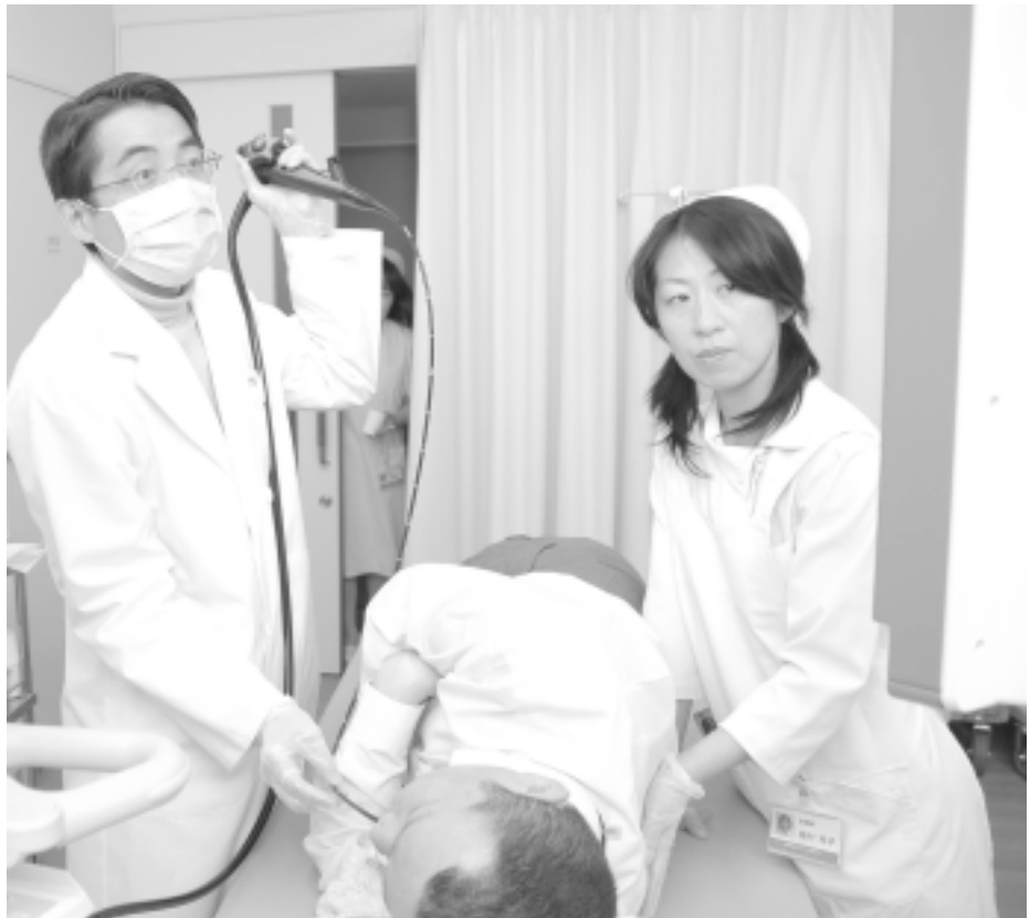
▲経鼻内視鏡検査 モニターは2台あり、自分もモニターを見ながら受検できる。 自分の内蔵を見ることができて大感激。お腹の中はピンク色でキレイでした。

最近テレビでも盛んに取上げられている経鼻内視鏡（鼻から入れる胃カメラ）を中濃地区で初めて導入しました。従来の胃カメラのような吐き気がほとんどなく、検査中にも会話ができる優れたものです。