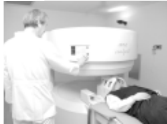
MR I 検査