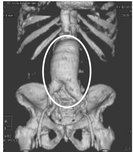
▲大きくなった腹部大動脈瘤（白線内）

なり、歩くと痛くなったり冷たくなる病气)の予定手術を提供できるようにになりました。