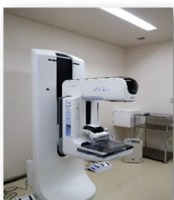
(マンモグラフィー装置)