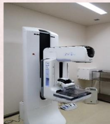
<マンモグラフィ装置>