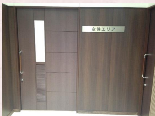
<女性エリア入り口>