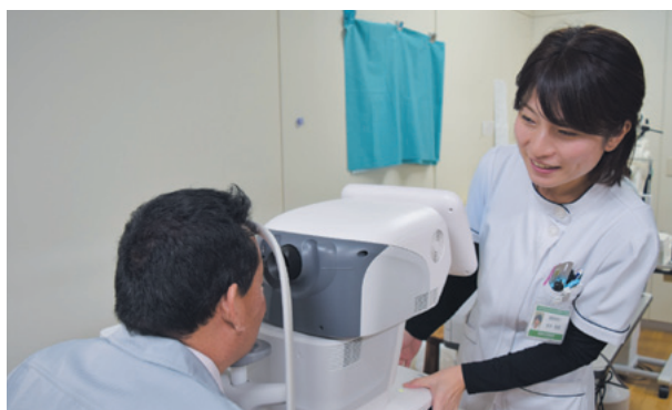
▲白内障手術時に挿入するレンズ度数を決定するための光学式眼軸長検査

白内障により視力が低下した人は、そうでない人と比べ、認知症リスクが2〜3倍高く、白内障の手術を受けた人は、受けていない人に比